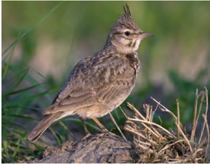
Forse zangvogel met opvallende kuif. Bruingrijze, gestreepte bovenzijde, lichte onderzijde met zwartgestreepte borst.

Jan Feb Mrt Apr Mei Jun Jul Aug Sep Okt Nov Dec